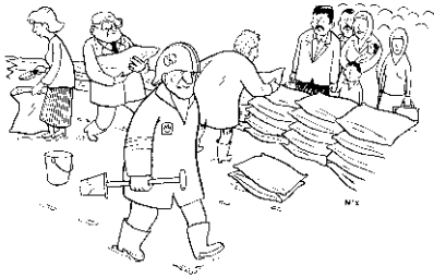
ER WERD MET MAN EN MACHT GEWERKT OM DE STROOM IMMIGRANTEN TEGEN TE HOUDEN.

W at doet mensen besluiten om hun land of streek te verlaten en elders heen te trekken? Een moeilijke vraag waarop ook de wetenschap nog geen sluitend antwoord heeft gevonden. Vast staat in elk geval dat het meestal niet één reden of één gebeurtenis is die mensen in beweging zet, maar een (ingewikkeld) geheel van motieven.